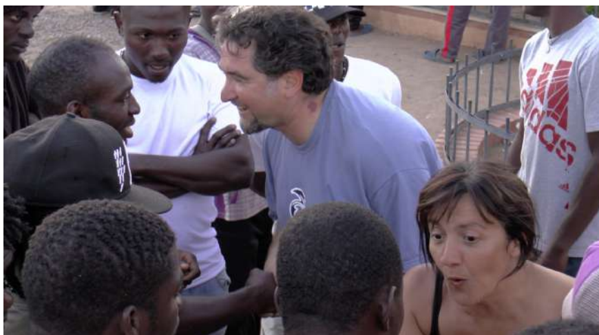
En la puerta del CETI en Melilla, tras la representación de Salud, Suerte y Ánimo.

Pero sin duda, en la historia de “Salud, Suerte y Ánimo” destaca la gira del verano de 2014 en la que se realizó una gira de emigrantes desde la valla de Melilla (Frontera Sur de Europa) hasta la Puerta de Brandemburgo (Berlín) .